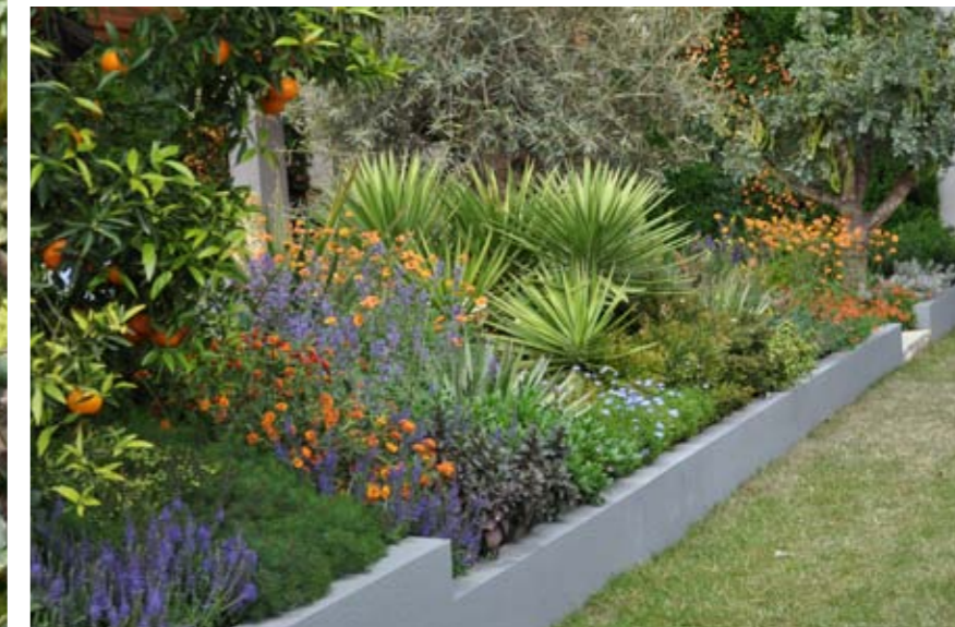
Monacká záhrada dizajnerky vypovedá o interakcii medzi architektúrou a krajinou v urbanizovanom prostredí.

P red dvadsiatimi ôsmimi rokmi, v čase keď vyštudovala krajinnú architektúru, sa záhradná architektúra ešte nepovažovala za skutočnú profesiu. S nástupom nových trendov sa však vyprofiloval nový pohľad na záhradný dizajn a ona sa v ňom dokázala pohotovo etablovať. S nadobúdaním nových skúseností si vybudovala celoživotný vzťah k profesii, ale i úspešnú kariéru. Osem zlatých medailí od Kráľovskej záhradníckej spoločnosti (RHS), množstvo ocenení z Chelsea flower show, Hampton Court či z iných kútov sveta z nej robia rešpektovanú a vyhľadávanú záhradnú dizajnerku.