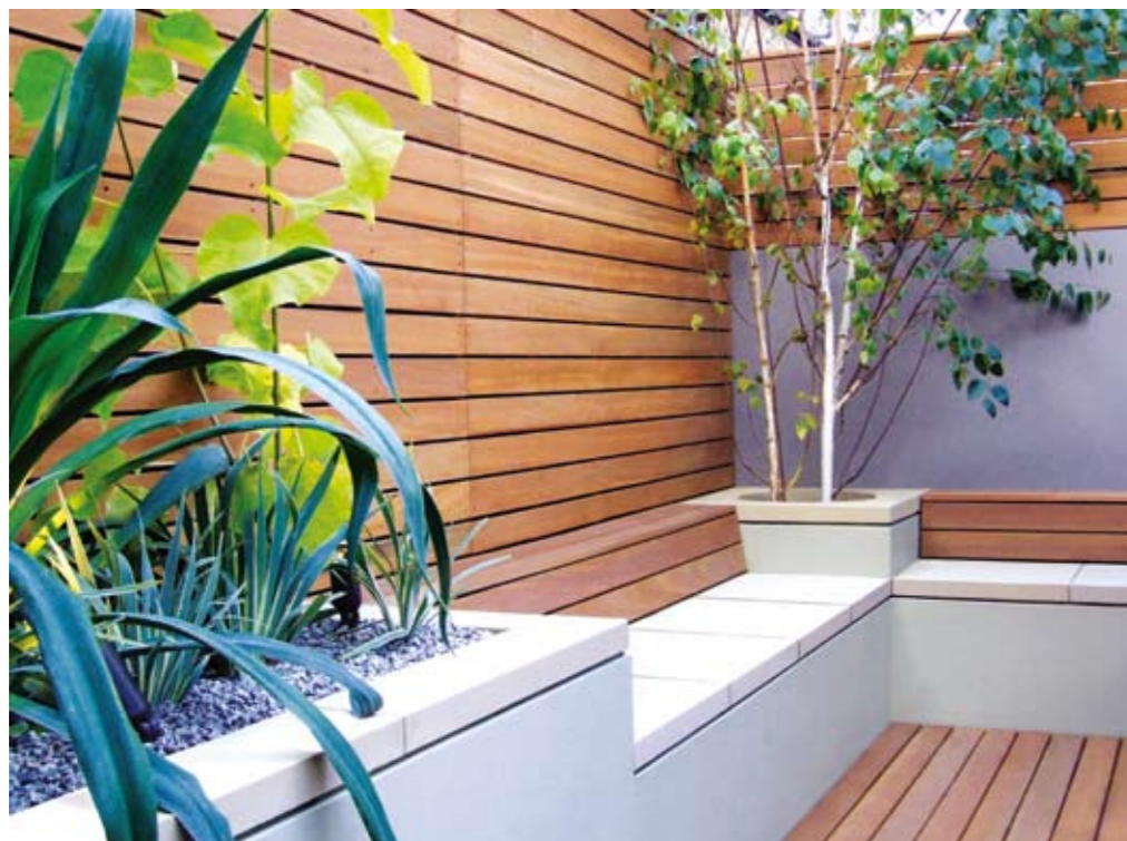
Zabudovanými lavičkami dokáže architekt záhrady nielen zútulniť, ale ich aj priestorovo vymodelovať.