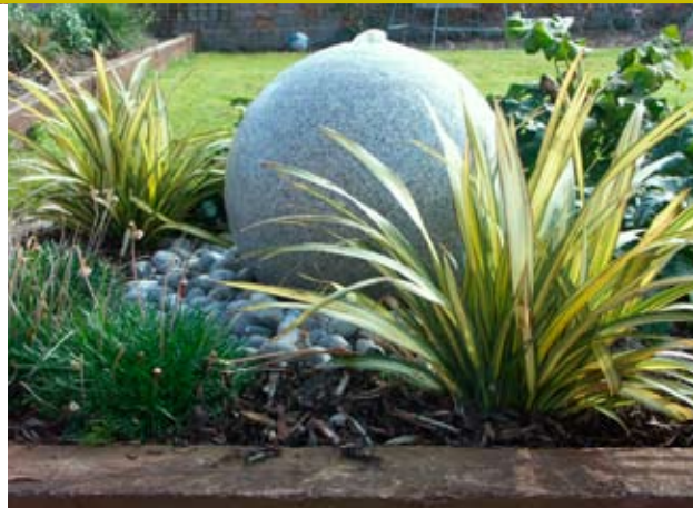
Na lem okrasného bazéna a na oddelenie trávniku od kvetinových záhonov boli použité pieskovcové platne nadväzne na materiál terasy.

ne. Príbuznosť materiálov a ich farebné zladenie je preto prvým dôležitým momentom pri projekcii záhrady. Je vhodné, ak použité materiály v interiéri alebo na fasáde objavia znovu aj v záhrade. Ide predovšetkým o rôzne pásovité obloženia z kameňov, tehál alebo palubkových prvky terás. Záhrada sa potom stáva predĺženou obytňou časťou, akousi vonkajšou obývačkou.