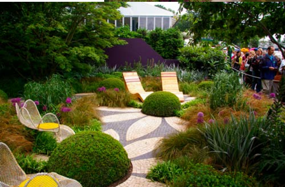
Výstavné záhrady Rolling Stone Landscapes udávajú módne trendy a ovplyvňujú smerovanie záhradného dizajnu vo svete.