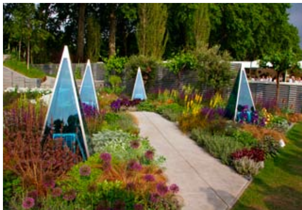
Výstavné záhrady Rolling Stone Landscapes udávajú módne trendy a ovplyvňujú smerovanie záhradného dizajnu vo svete.